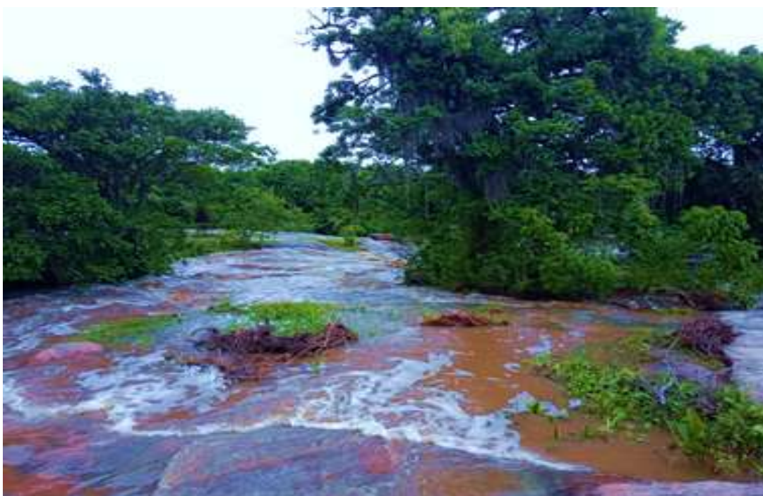
Figura 5 – Aguilhadas