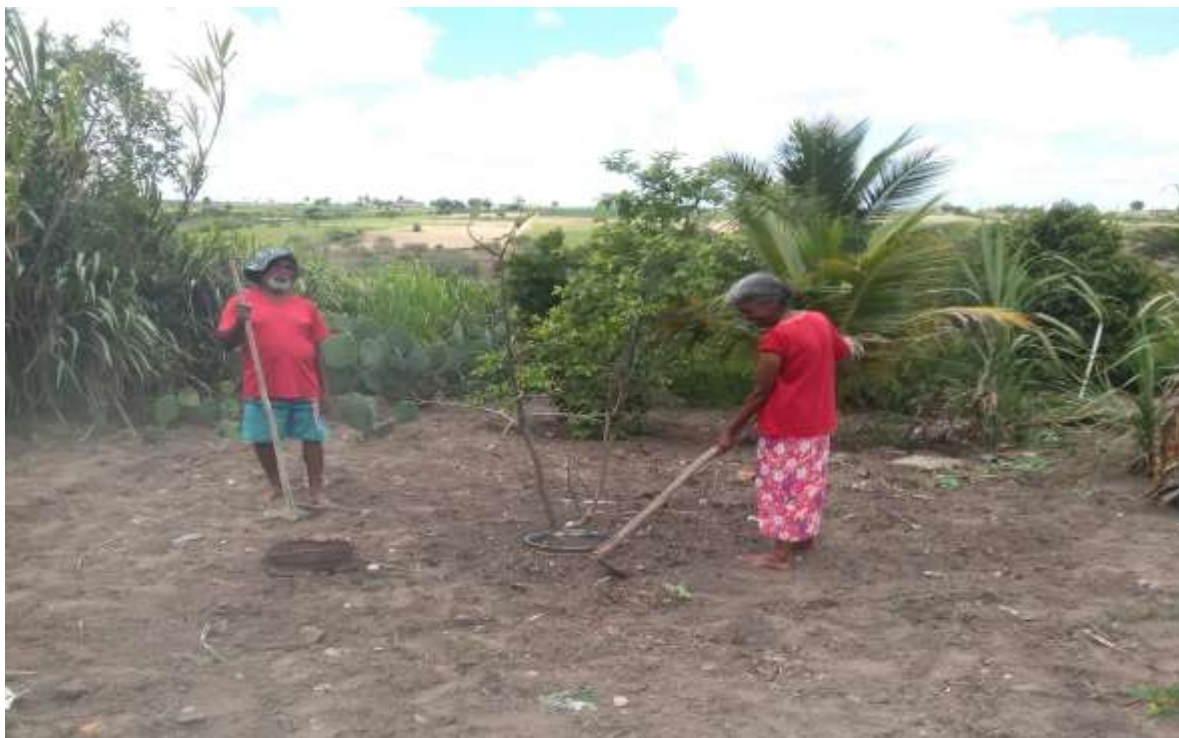
Figura 20 – Agricultores realizando o plantio de suas sementes crioulas