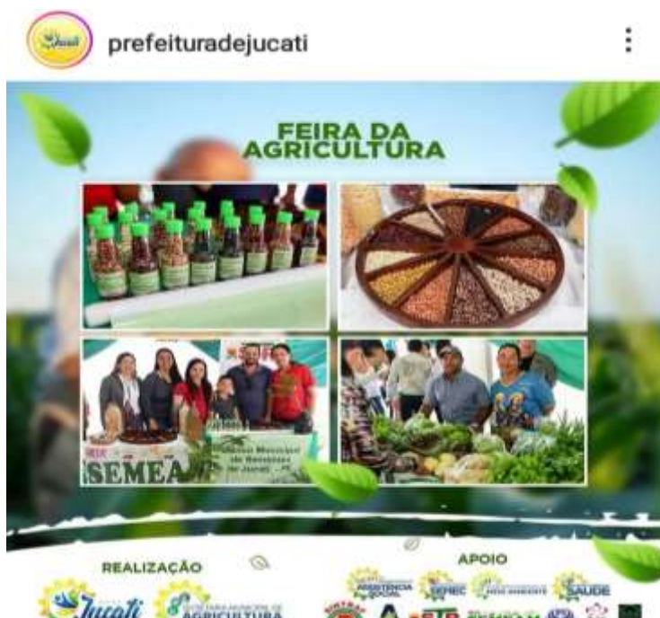
Figura 19 - Feira Agroecologia