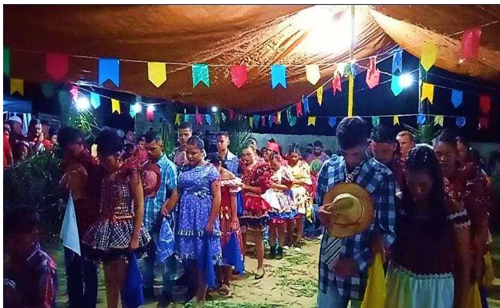
Figura 11 - Quadrilha São José da comunidade Sítio Cachoeira.

Na figura – 11, é possível visualizar a apresentação da quadrilha São José que aconteceu no dia 19 de junho de 2022, festejo que foi realizado após o decreto 6 de liberação para a realização de festas e comemorações. Depois de dois anos sem apresentações na comunidade devido a pandemia enfrentada pelo mundo de 2020 a 2022. Esta imagem representa a simbólica homenagem de um minuto de silêncio para todas as vítimas da COVID- 19, e em especial os falecidos da comunidade que faziam parte da Quadrilha São José.