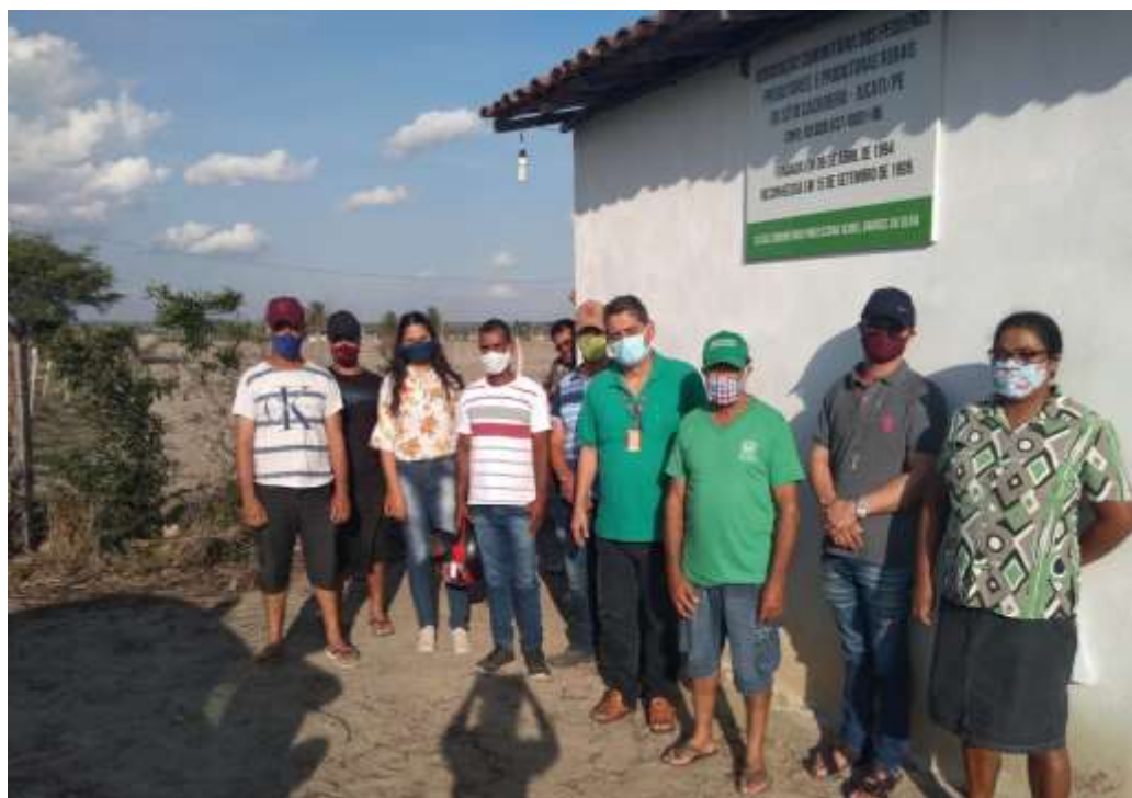
Figura – 12: Associação Comunitária dos Pequenos Produtores e Produtoras Rurais do Sítio Cachoeira.

Na figura 12, é possível observar um registro fotográfico da parte externa da associação, após a realização da reunião mensal. Devido ao período da pandemia provocada pela Covid-19, a reunião tinha pouca participação da comunidade.