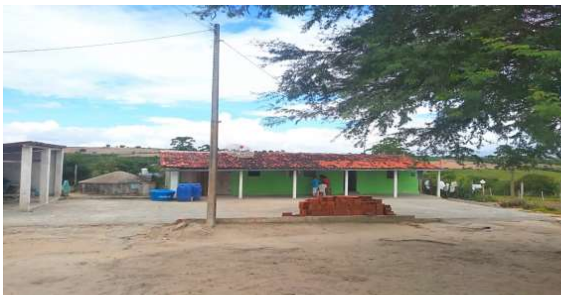
Figura – 8: Moradias no Sítio Cachoeira

Atualmente, as casas na comunidade são todas feitas com blocos de tijolos, possuem o telhado de telhas colonial ou comuns e madeira (ripas e caibros), ou seja, são casas de alvenaria. Na ( figura – 8 ), é possível observar algumas das residências da comunidade e os roçados dos moradores.