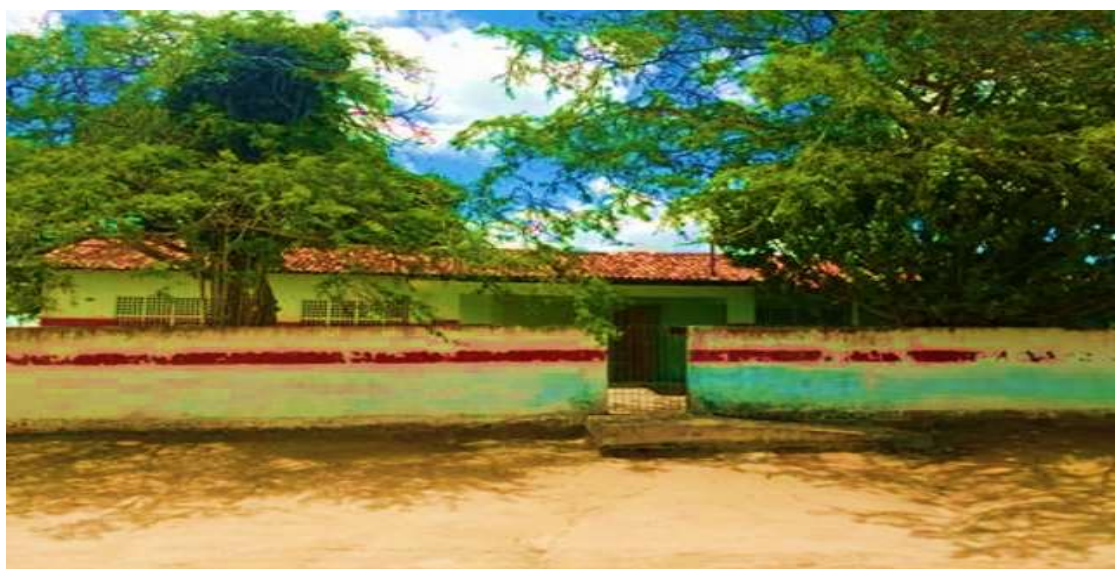
Figura 10 – Escola do Campo na comunidade

No Sítio Cachoeira existe uma escola do campo 5 , a Escola Municipal Reunida Olindina Barros, que iniciou suas atividades no Casarão. Atualmente, como pode ser observado na (figura 10), nesta escola é ofertada a Educação do Ensino Fundamental anos iniciais, com funcionamento manhã e tarde. Esta escola atende os estudantes da comunidade e de outros sítios vizinhos, porém, como a escola não oferece os anos finais do Ensino Fundamental, nem o Ensino Médio, estes adolescentes e jovens precisam se deslocar para a área urbana, ou para o distrito. Esse processo de nucleação dos alunos do campo em escolas da área urbana segue em sentido contrário aos princípios defendidos pela Educação do Campo.