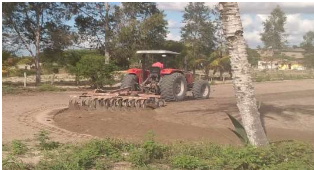
Figura 23 -O uso de maquinários de pequeno porte na produção rural

Nesta figura, é possível visualizar um agricultor familiar realizando a aração por meio do uso de tração animal. Atividade que deve ser realizada com um animal dócil e ao mesmo tempo habilidoso e robusto. Quando o agricultor familiar não possui um animal com tais qualidades, tende a convidar um vizinho que possui, para que este possa arar a terra. Além dos arados de tração, os tratores e ciladeiras são exemplos condizentes com os avanços e realidade do campo.