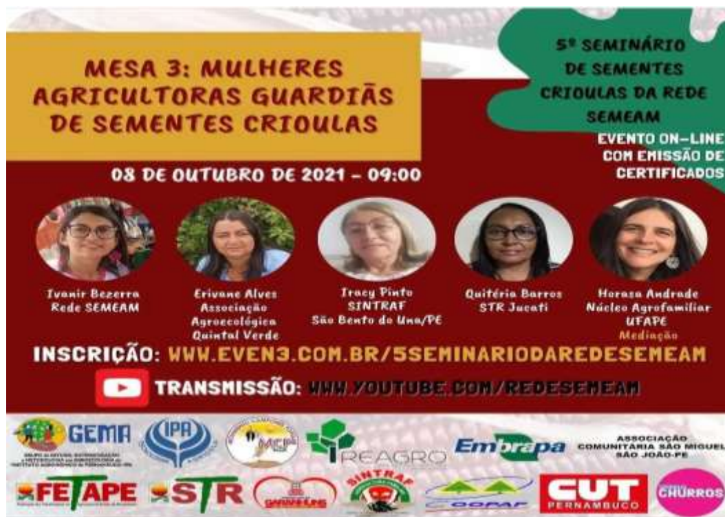
Figura 24 -Mesa de mulheres agricultoras guardiãs de sementes crioulas