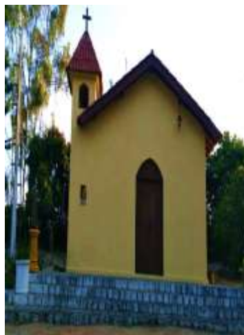
Figura 14 – Capela São Joaquim Figura 15 – Igreja Batista