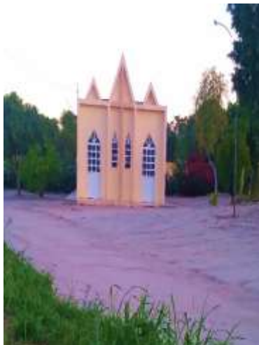
Figura 13 – Capela São José

É uma comunidade de predominância religiosa cristã, possui duas capelas, a Capela São José e Capela São Joaquim, e uma igreja denominada Igreja Batista Resgatando Vidas.