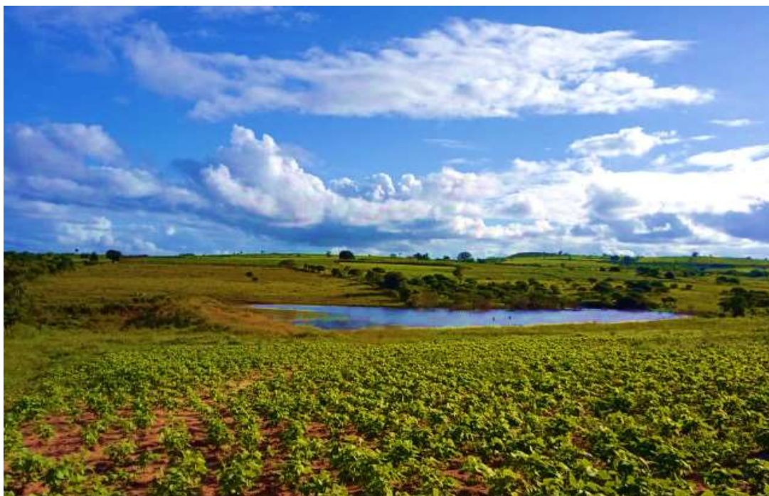
Figura 4 - Açude de pesca para consumo e para comercialização