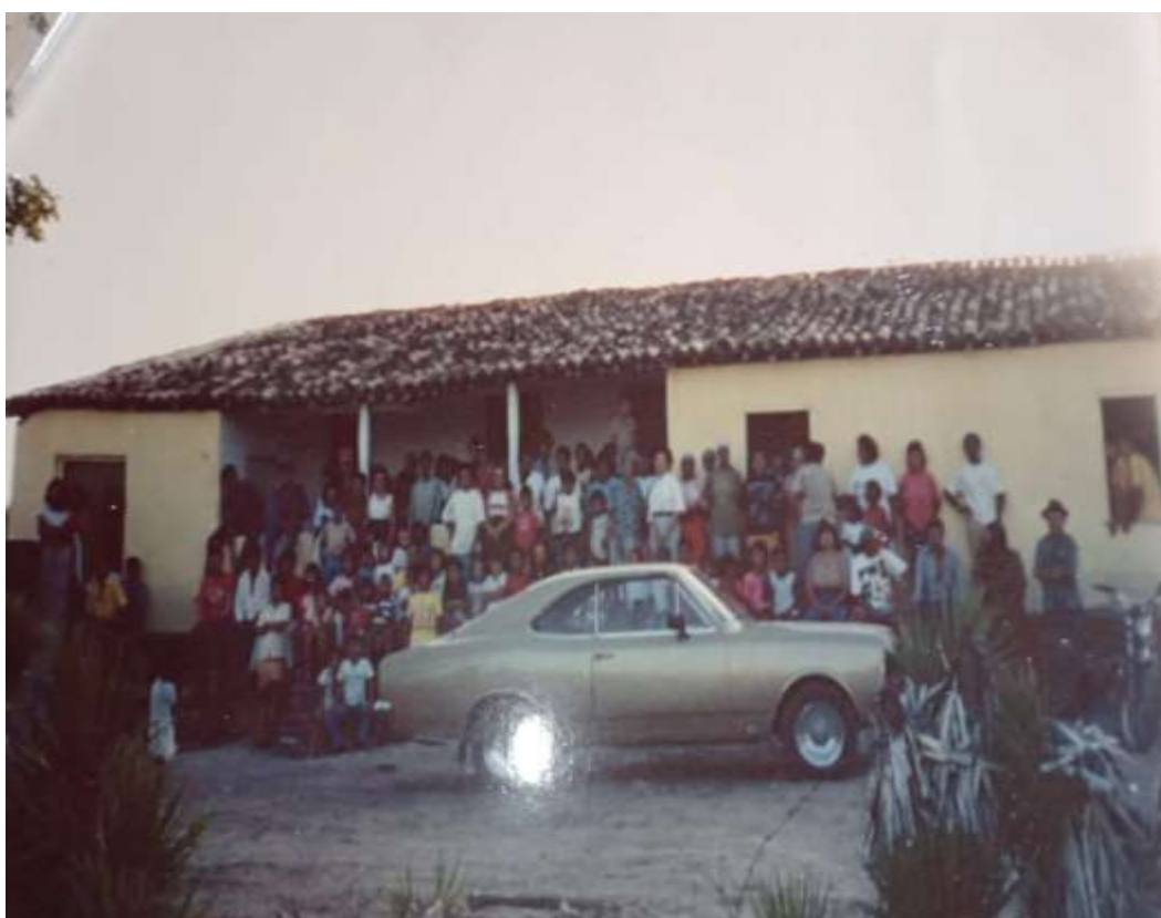
Figura 9 -Casarão do Sítio Cachoeira

Na figura – 9, é possível observar uma foto do casarão, enquanto lugar de experiência e memórias afetivas para muitos do Sítio Cachoeira. Sendo este o local para festas religiosas, batismos, para festas populares, e também, por muitas décadas, foi o espaço físico que as pessoas estudavam por meio de salas multisseriadas. Por muito tempo, para a comunidade, foi um espaço não oficial de ensino e aprendizagens, lugar que as pessoas ditas alfabetizadas ensinavam a ler e escrever.