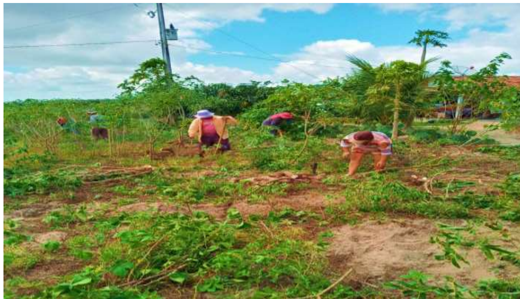
Figura 16 – Agricultores e agricultoras desenvolvendo atividade agrícola da retirada de mandioca