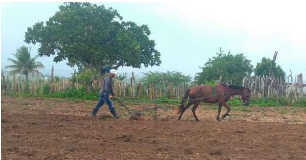
Figura 22 – Relação homem e natureza, o arado a tração animal

animal, e também dos homens. No Sítio Cachoeira, a aração de terra por meio desse mecanismo é predominantemente realizada por homens, já que requer uma forma maior.