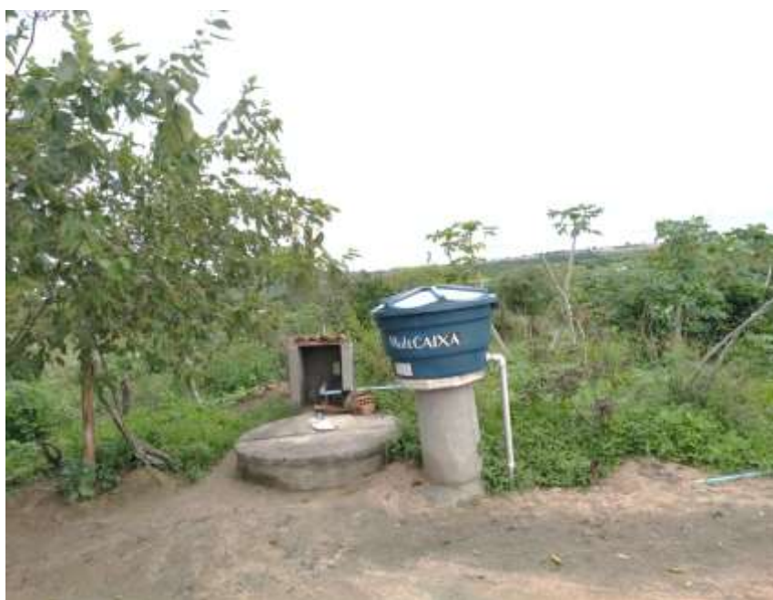
Figura 18: Bioágua

produtos dos agricultores familiares de forma organizada, realizando entregas a domicílio e também em feiras locais. Ambos projetos tem como apoiadora a Fundação Banco do Brasil, que financia os recursos necessários para a construções de cisternas e Bioáguas, além disso, para a implementação e promoção da educação alimentar, sistema de saneamento básico como a construção de banheiros pela área rural. Para a educação alimentar, a parceria com a gestão municipal visa promover formações das equipes escolares, com palestras dos nutricionistas e dos agricultores familiares sobre as formas de produção e utilização destes alimentos nas merendas escolares. Além disso, há formações que são realizadas pelo Instituto Agrônomo de Pernambuco – IPA.