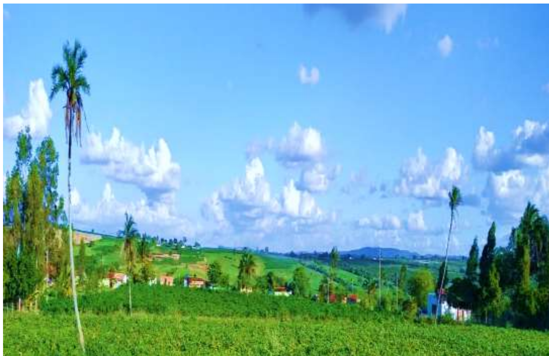
Figura 17 – Plantações dos trabalhadores rurais