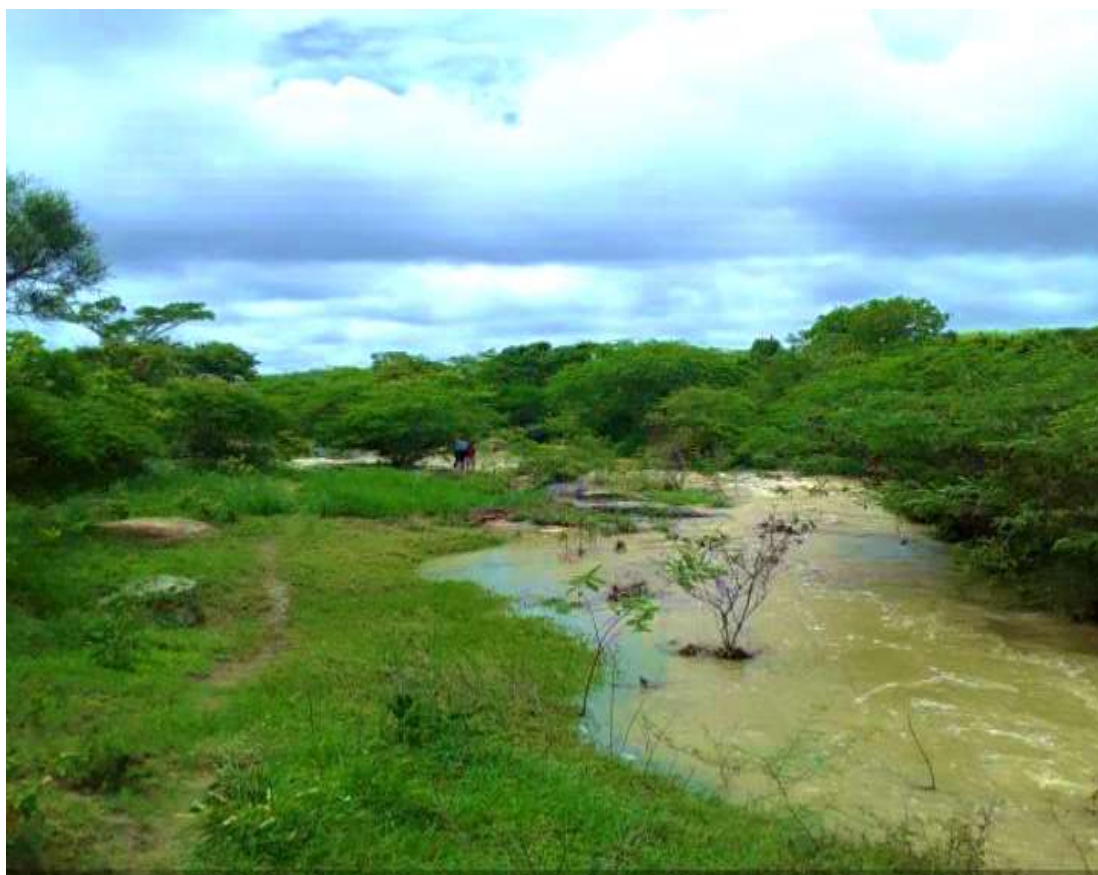
Figura 3 – Trecho do Rio Canhoto

Na imagem a seguir vemos um trecho do Rio Canhoto, na comunidade