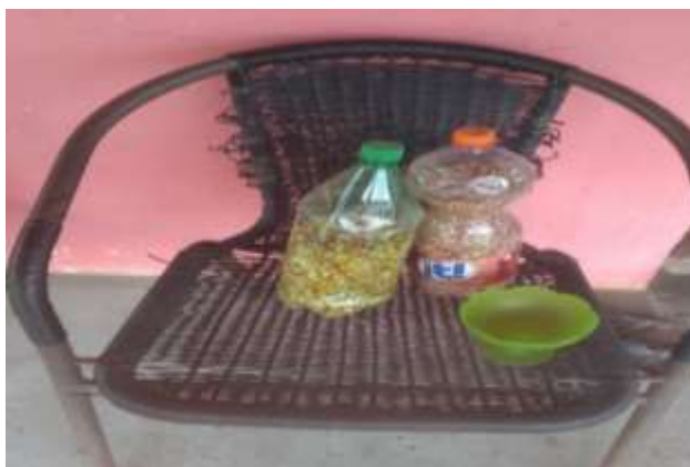
Figura 21 - Conservação das sementes em garrafas Pets